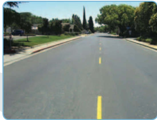
Та же дорога через 9 лет (2009 год) после нанесения «Кейп Сила».