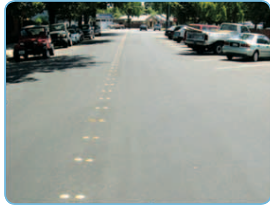
Та же дорога через 8 лет (2007 год) после нанесения «Кейп Сила».