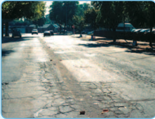
Состояние одной из дорог в 1999-м году до нанесения «Кейп Сила».