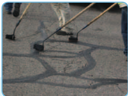
Сначала трещины на дороге должны быть отремонтированы.

Третья стадия – после недельной эксплуатации в дорожном движении наносится «Сларри Сил» и обработка завершается.