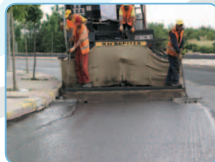
В завершении наносится «Сларри Сил» в соответствии со стандартами, и обработка завершается.