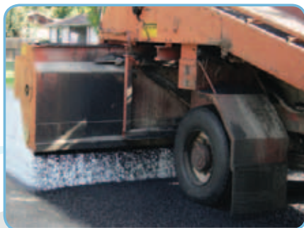
«Чип Сил» наносится в соответствии со стандартами.