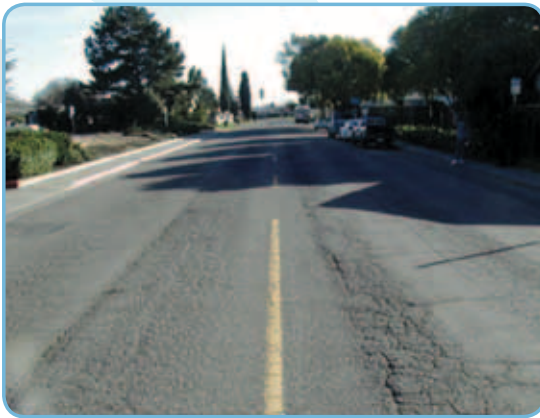
Состояние одной из дорог в 2000-м году до нанесения «Кейп Сила».