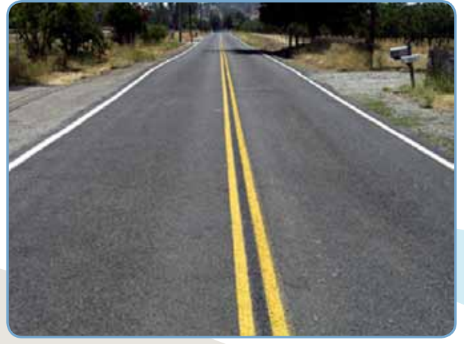
Yine aynı yolun yapımından 3 yıl sonraki 2008 deki son durumu.