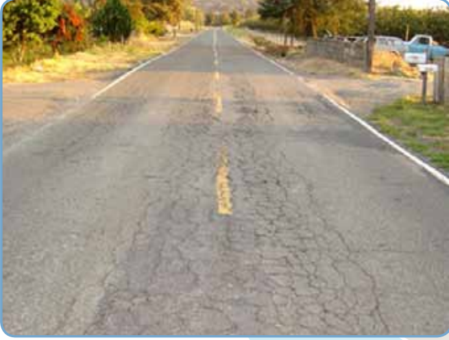
2005 yılında Bozulmaya yüz tutmuş bir yolun Chip Seal (Sathi kaplama) Yapılmadan önceki durumu.

Ekonomik olması nedeni ile düşük hacimli yollarda oldukça yaygındır. Ancak teknolojinin ve ekipmanların gelişmesi ile yerleşim alanları ve yüksek hacimli yollarda da sathi kaplama popüler hale gelmiştir.